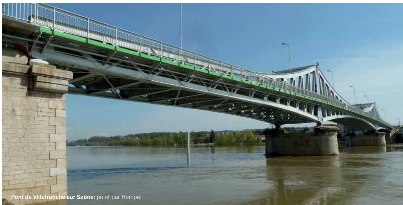
Pont de Villefranche sur Saône: peint par Hempel