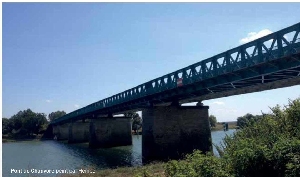
Pont de Chauvort: peint par Hempel