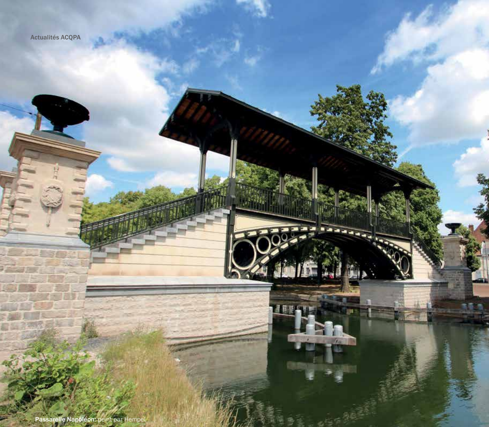
Passarelle Napoléon: peint par Hempel