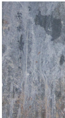
Silicate de zinc